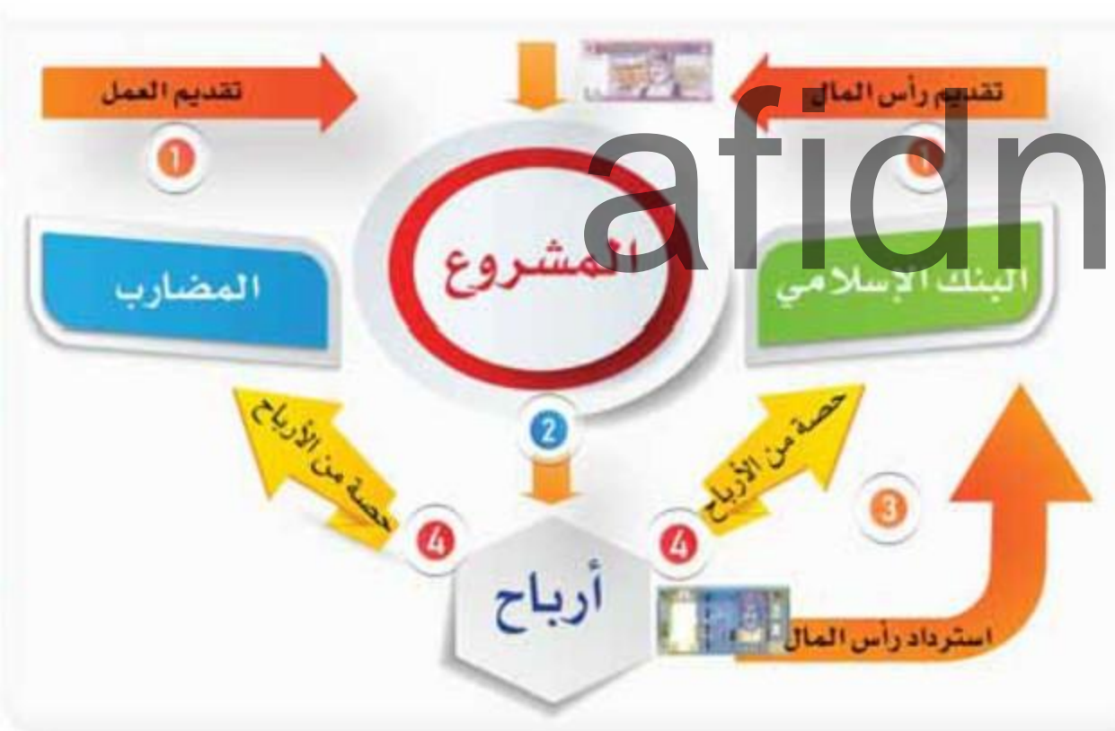
الشكل (٤) الخطوات العملية للمضاربة في حالة الربح.

• المضاربة: وذلك بأن يعطي المصرف مالاً لجهة على أن تثمره في التجارة على جزء معلوم من ربح المال؛ ثلثاً أو ربعاً أو نصفاً، وبذلك يتكفل البنك بالمال ويتكفل المضارب بالجهد، ثم يشتركان في الربح والخسارة.